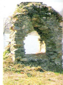
Utrinki s poti